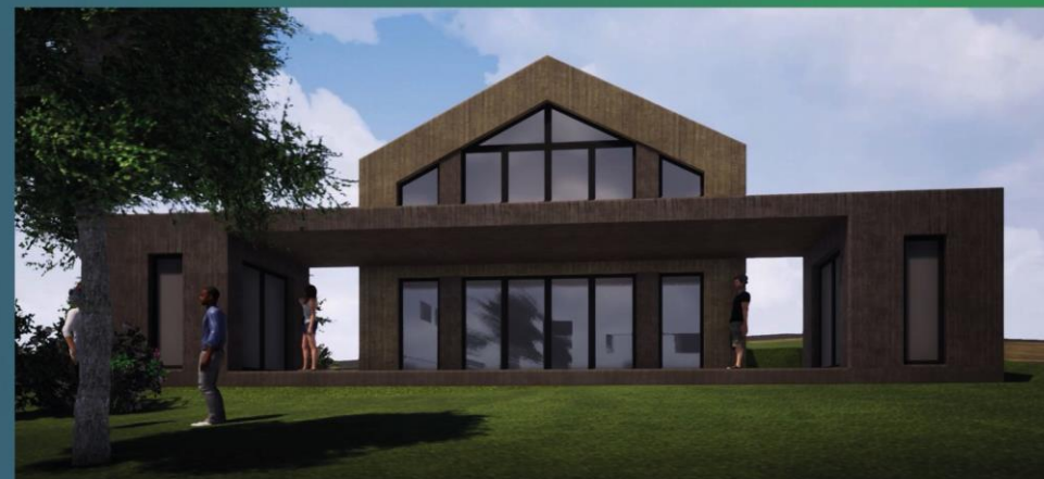
Inklusivni volonterski centar PAPUK